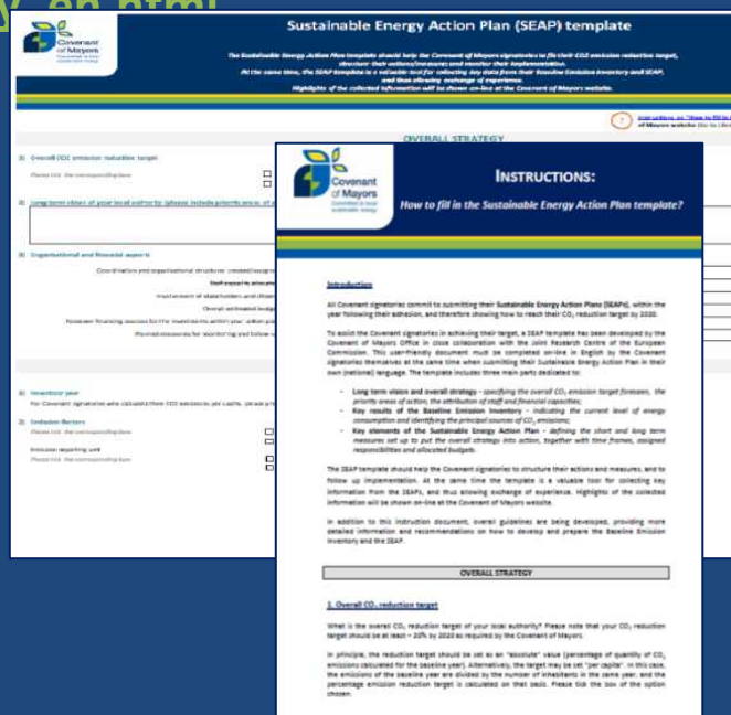
SEAP template instructions “How to fill in the SEAP template?”, available in 23 EU languages!!

✓ Τεχνικές πληροφορίες: http://www.eumayors.eu/about/technical-inquiry_en.html